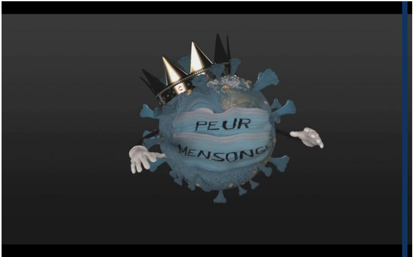
Capture d'écran du documentaire «Hold-Up»