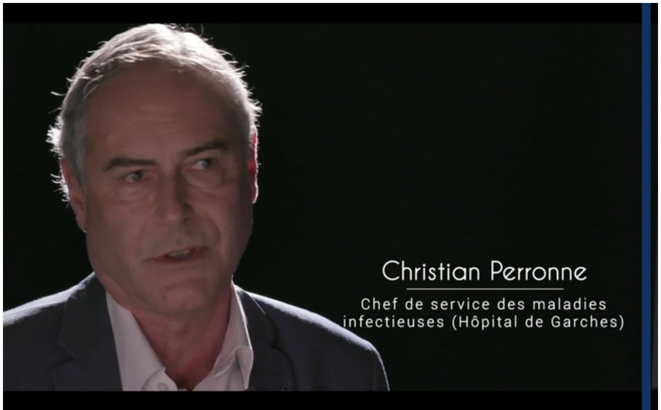
Capture d'écran du documentaire "Hold-Up"