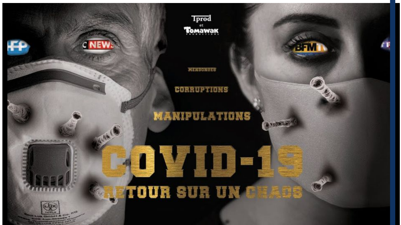
Affiche du documentaire sur YouTube. Photo Thana TV. Tprod. Tomawak

Par Vincent Coquaz et Robin Andraca 11 novembre 2020 à 13:20